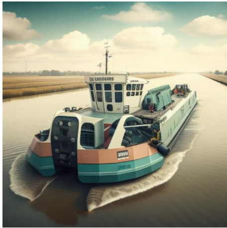
Abbildung 1: generiert mit Midjourney