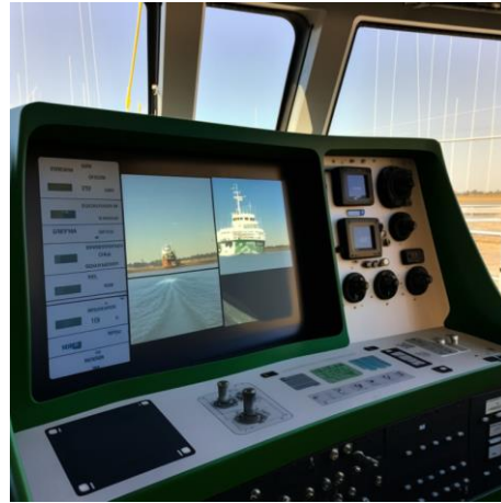
Abbildung 2: generiert mit Midjourney

Kurztext (Teaser): Hochautomatisiert fahrende Binnenschiffe sollen den Gütertransport auf der Wasserstraße zukünftig attraktiver und effektiver gestalten. Damit diese Vision Wirklichkeit wird, müssen die Sicherheit und der Automatisierungsgrad der Schifffahrt erhöht werden. SensorSOW will die technischen Voraussetzungen dafür an Bord weiter vorantreiben. Im Projekt sollen Sensor- und Assistenzsysteme zur bordseitigen Bestimmung der Schiffs- und Verkehrslage sowie der Fahrrinne unter Wasser entwickelt und mittels bestehendem Versuchsträger und Testschiffen im digitalen Testfeld Spree-Oder-Wasserstraße (SOW) erprobt werden.